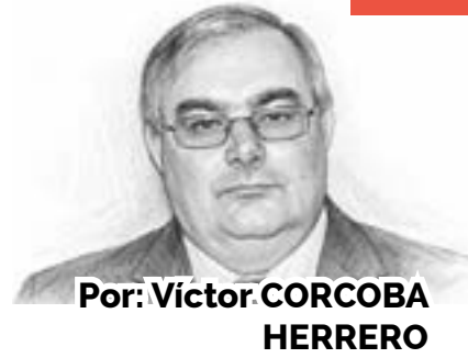
Por: Víctor CORCOBA HERRERO

“La unión genera vínculos que nos fortalecen, sobre todo en las cosas necesarias, en cuanto comunión íntima de vida y amor que somos, como familia natural, mientras la discordia todo lo debilita”.