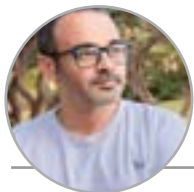
Por el Lic. Prof. Nelson Borges @nelsonandresborges

¿Alguna vez has sentido que no eres suficiente? Que siempre hay alguien más pintón, rápido, más inteligente, más exitoso, que juega mejor al fútbol? Es normal sentir eso.