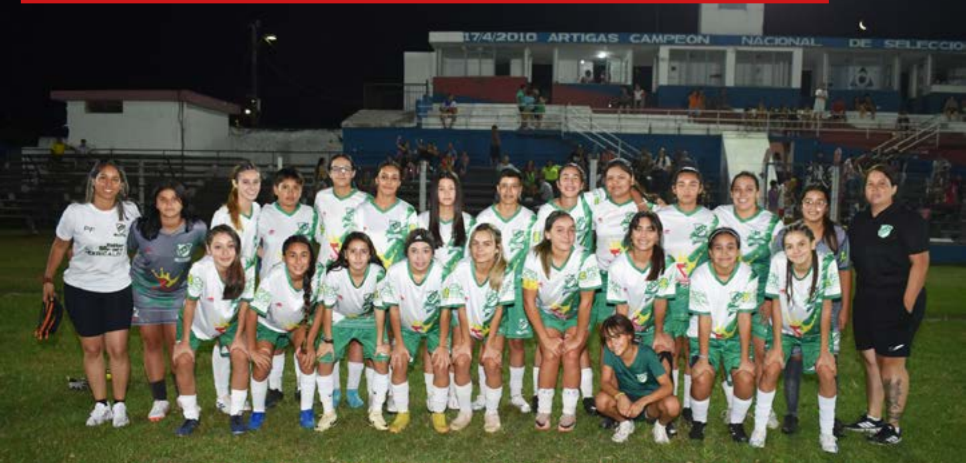
INDEPENDENCIA FEMENINO SUB-17 - TEMPORADA 2025