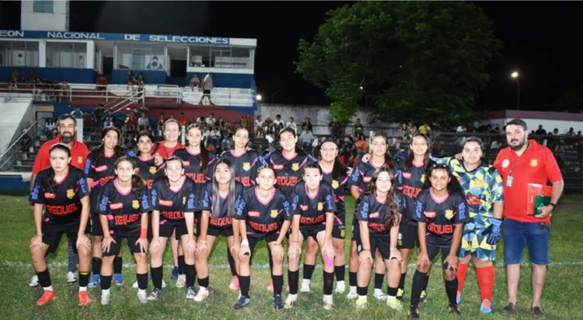
ZORRILLA FEMENINO SUB-17 - TEMPORADA 2025

LURAGO FOTOS - TEL. 4772 4479 - CEL. 098 574 184