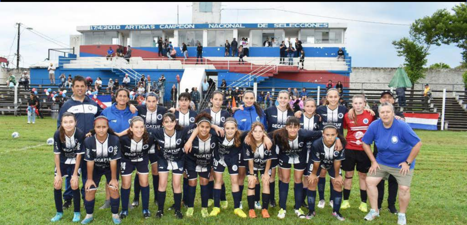
ARACHANAS de MELO - COPA O.F.I. de FÚTBOL FEMENINO sub-14 Artigas, Noviembre de 2023

Finales femenina y masculina sub-14. A primera hora Artigas Femenino 1, Arachanas de Melo 3. A segunda hora Artigas Masculino 3, Selección de Maldonado 0. Se jugaron ambos partidos con un piso del Estadio Matías González, en muy mal estado, totalmente halagado, por las intensas precipitaciones previas al evento, y durante el transcurso del mismo. Incluso hubo esporádicas apariciones de descargas eléctricas, lo que no fue tenido en cuenta por la terna arbitral, continuando con el desarrollo