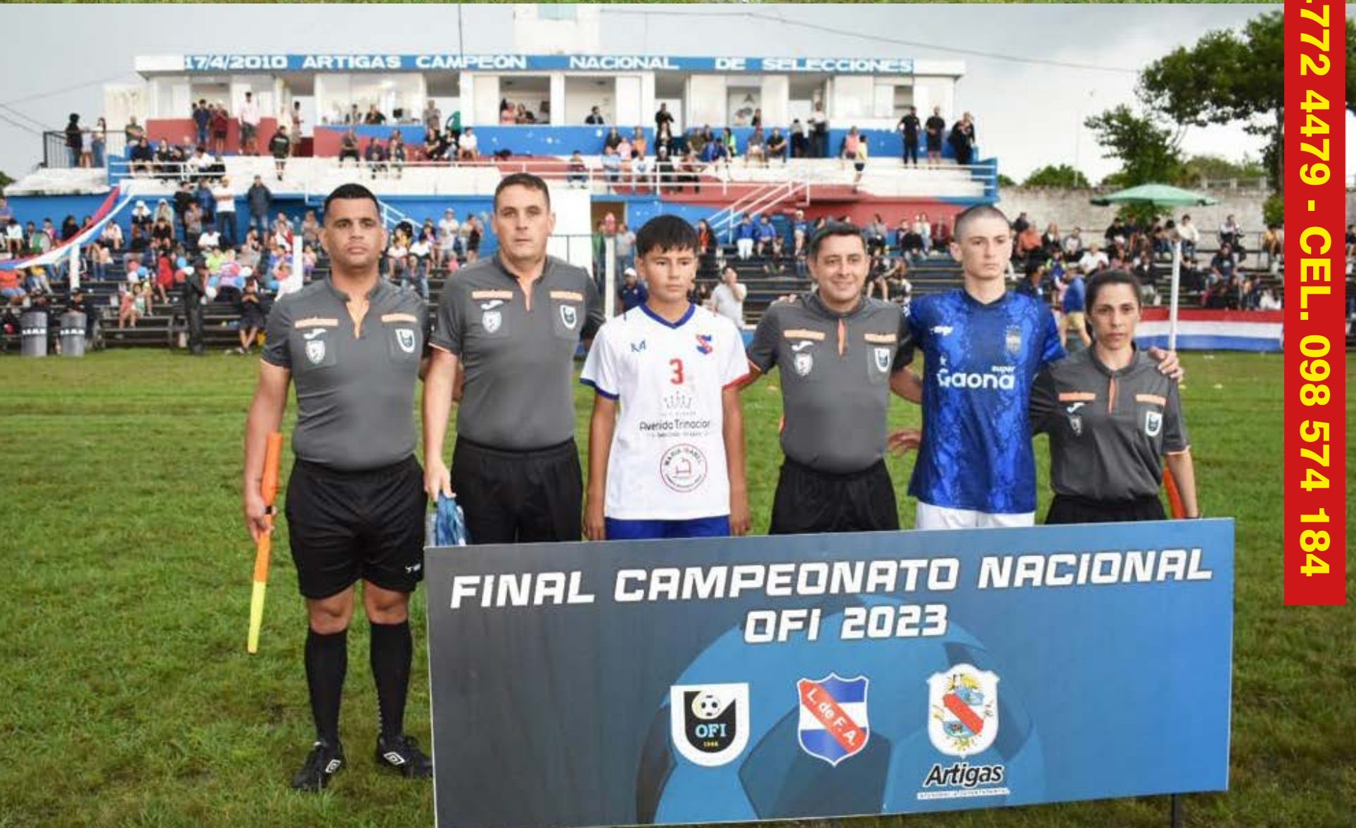
Artigas, Noviembre de 2023