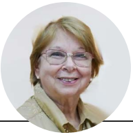
Por: Prof. Celeste Paiva

C onvengamos en que los libros son un llamador, el motivo de encuentro con la lectura, para que leer sea una experiencia tan necesaria como frecuente en nuestras vidas. El concepto reivindicativo, acerca de los valores de la lectura, fue defendido por el docente comprometido con el tema que ha partido dejando inconclusa su labor.