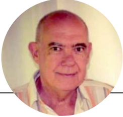
Por: Dr. Ricardo Castelli

“Cuando veas las barbas de tu vecino arder, pon las tuyas en remojo” Viejo refrán