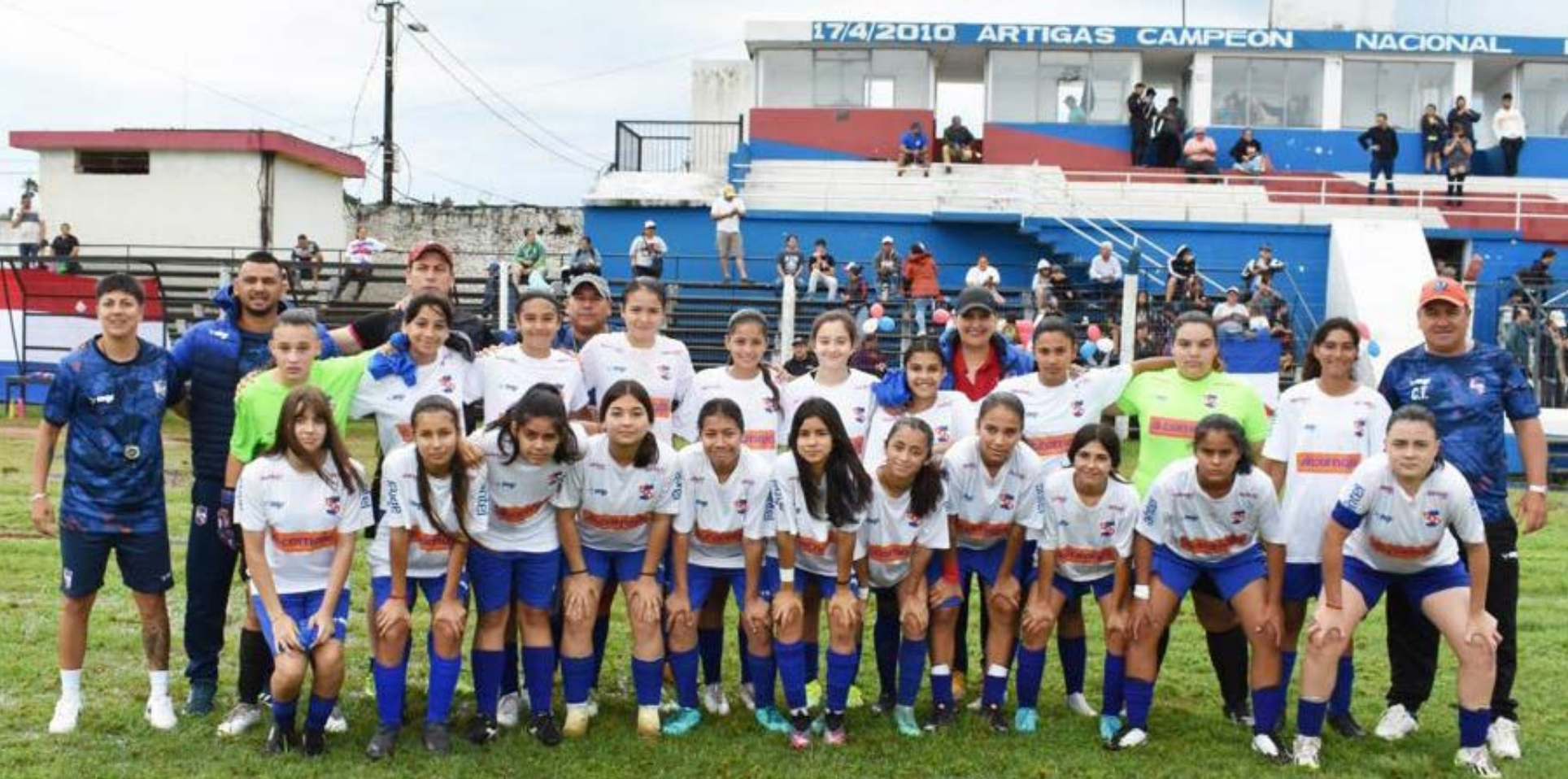
ARTIGAS FEMENINO SUB-14 - COPA O.F.I. - Artigas, Noviembre de 2023

Finales femenina y masculina sub-14. A primera hora Artigas Femenino 1, Arachanas de Melo 3. A segunda hora Artigas Masculino 3, Selección de Maldonado 0. Se jugaron ambos partidos con un piso del Estadio Matías González, en muy mal estado, totalmente halagado, por las intensas precipitaciones previas al evento, y durante el transcurso del mismo. Incluso hubo esporádicas apariciones de descargas eléctricas, lo que no fue tenido en cuenta por la terna arbitral, continuando con el desarrollo