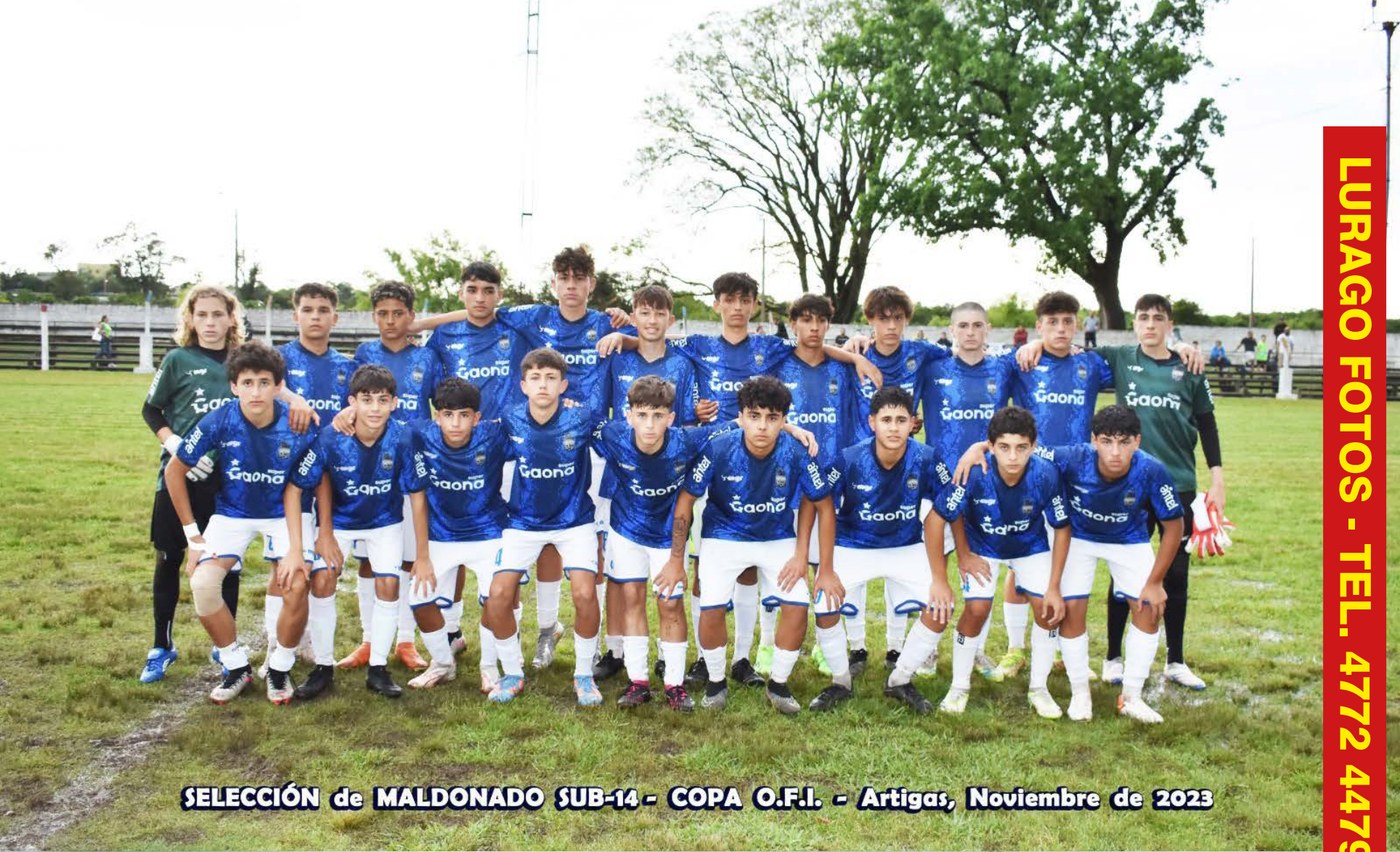
SELECCIÓN de MALDONADO SUB-14 - COPA O.F.I. - Artigas, Noviembre de 2023