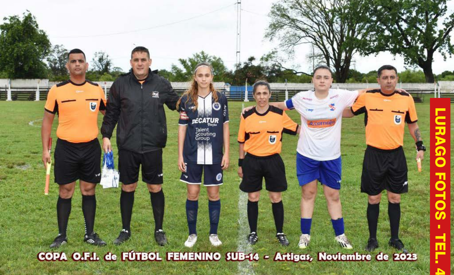
COPA O.F.I. de FÚTBOL FEMENINO SUB-14 - Artigas, Noviembre de 2023