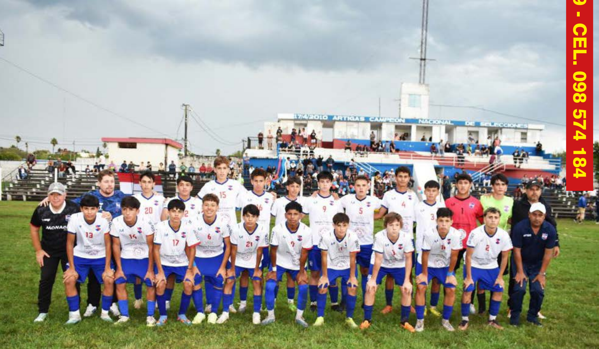
SELECCION de ARTIGAS SUB-14 - COPA O.F.I. - Artigas, Noviembre de 2023