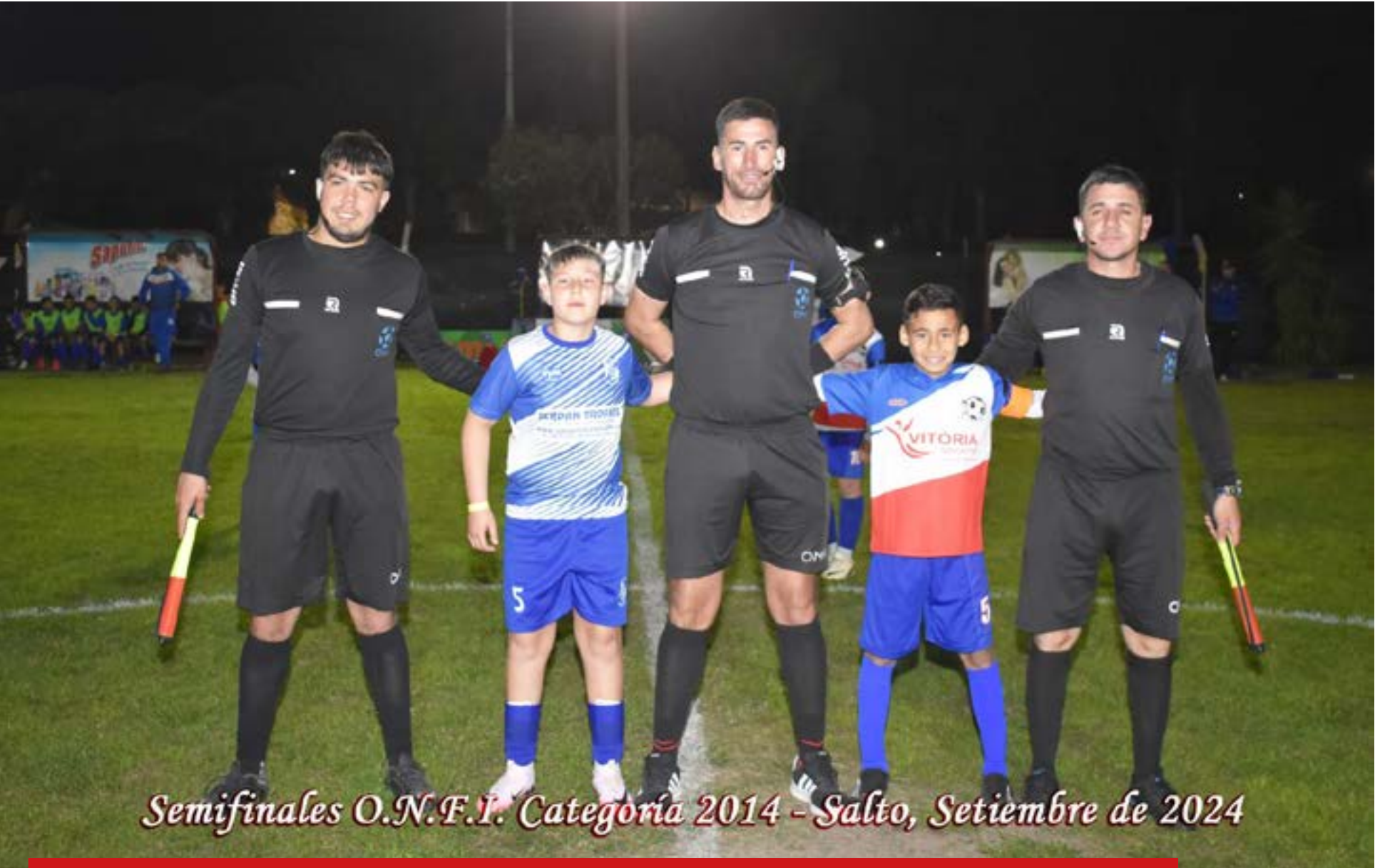
Semifinales O.N.F.I. Categoría 2014 - Salto, Setiembre de 2024