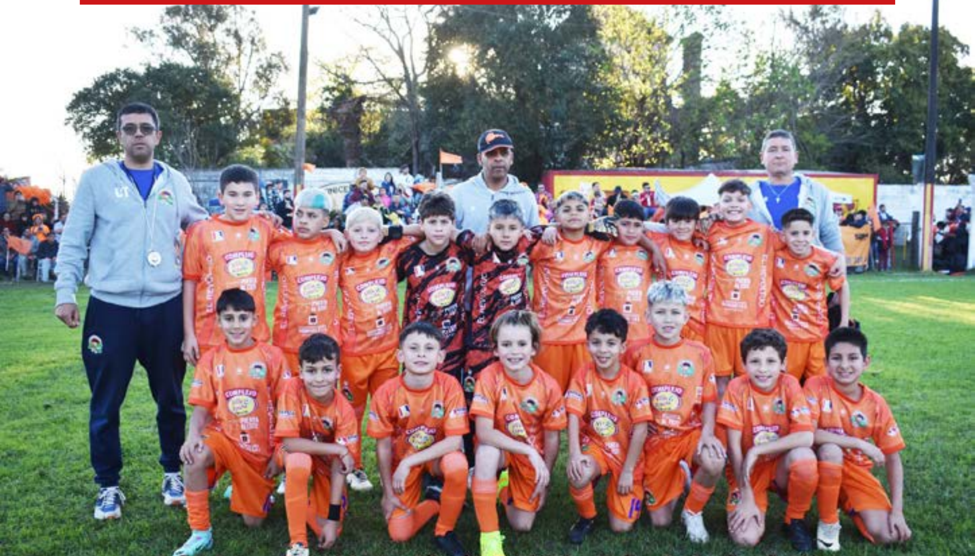
Salto Categoría 2014 - Semifinales O.N.F.I. - Salto, Setiembre de 2024