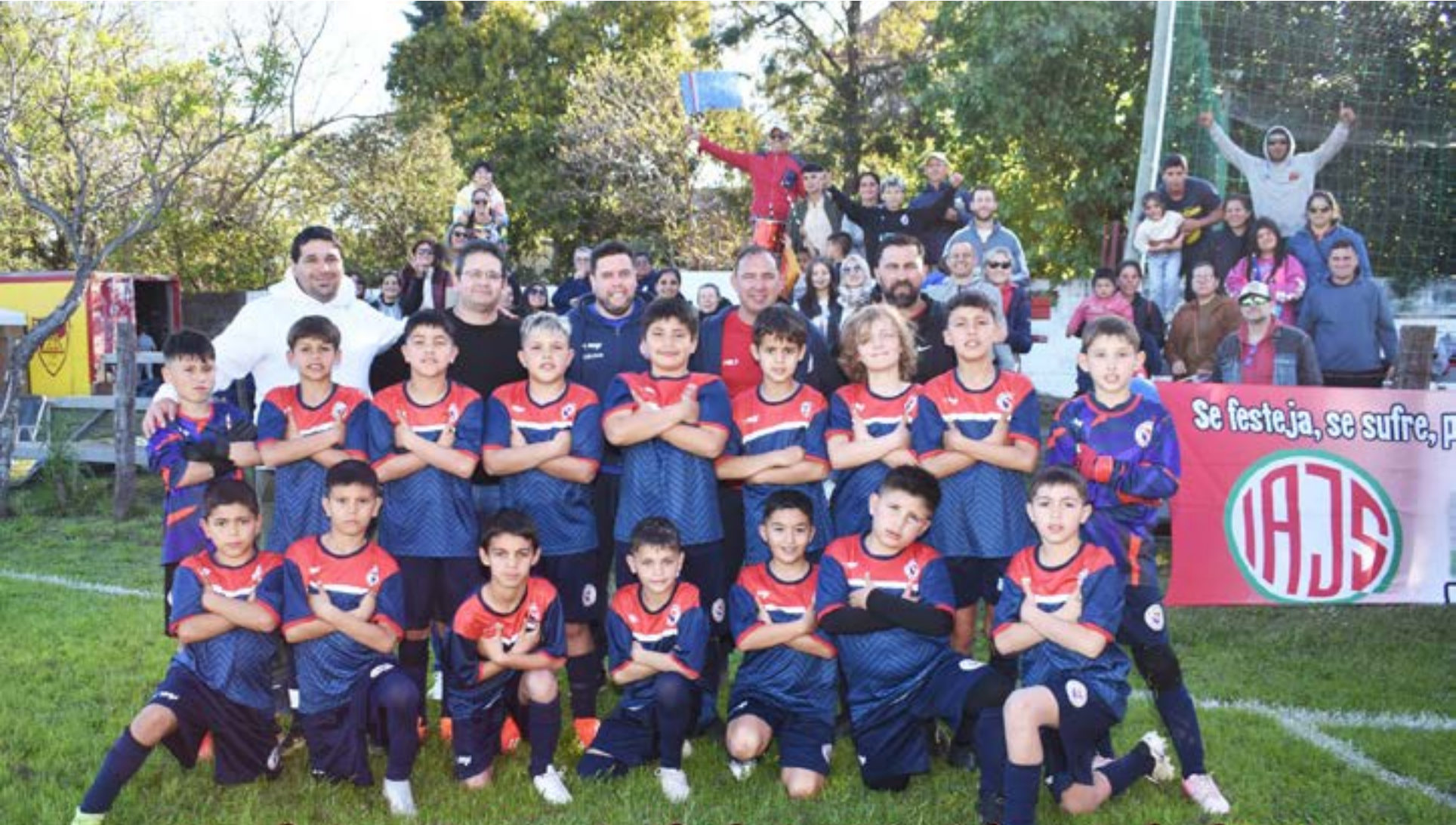
Mercedes Categoría 2014 - Semifinales O.N.F.I. - Salto, Setiembre de 2024