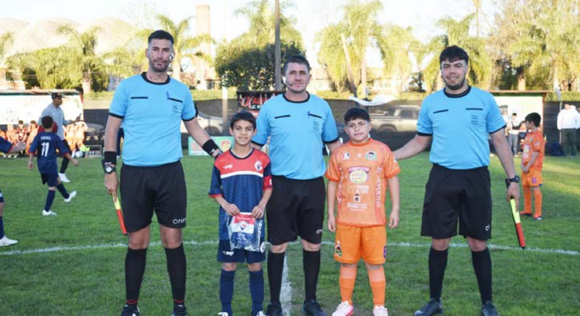
Semifinales O.N.F.I. Categoría 2014 - Salto, Setiembre de 2024