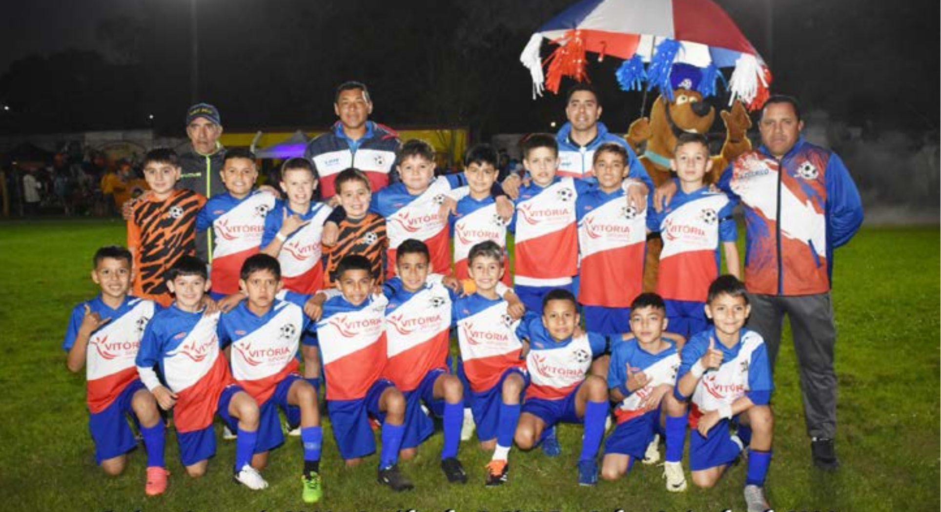
Artigas Categoría 2014 - Semifinales O.N.F.I. - Salto, Setiembre de 2024