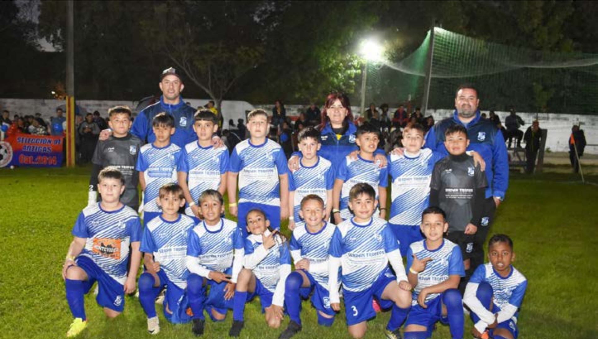
Piedras Blancas Categoría 2014 - Semifinales O.N.F.I. - Salto, Setiembre de 2024