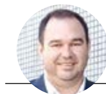
Por: Dr. Daniel Volpi Avedutto

En la Escuela primaria, años 80, los maestros me enseñaron que en Uruguay contábamos con un clima templado con 4 estaciones bien marcadas: Verano, Otoño, Invierno, Primavera; esas estaciones eran rotatorias durante el año. Durante la enseñanza secundaria, precisamente en la materia Geografía los profesores me confirmaron lo que había aprendido en primaria. Además toda la enseñanza avalada con textos, sí, libros escritos por especialistas en la materia.