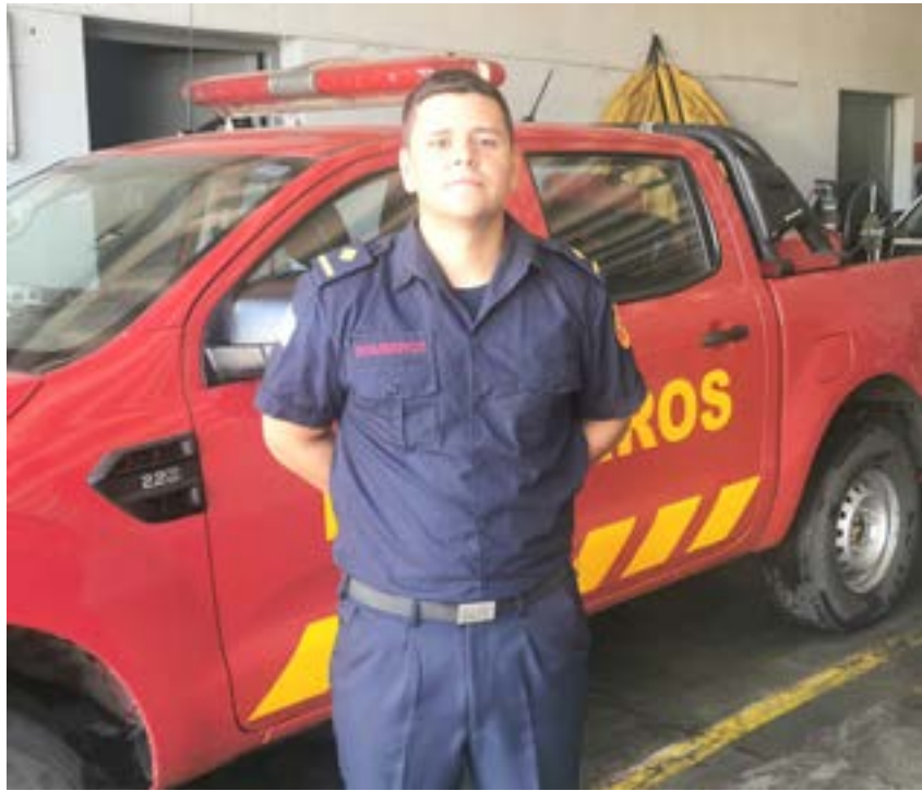
Redacción: Carla de Souza Nota: Rodrigo Nuñez

Aunque el verano presenta menos focos de incendio que el año pasado, la llegada de la ola de calor y la sequía coloca al departamento en una situación de alto riesgo. Bomberos reiteran la prohibición absoluta de quemas y refuerzan recomendaciones preventivas.