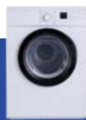
Lavasecarropas o secarropas