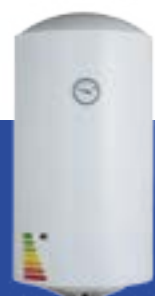
Termotanques de 40 litros o más clase A