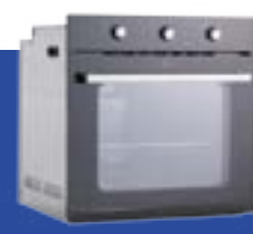
Hornos de empotrar cocinas totalmente eléctricas y anafes de inducción