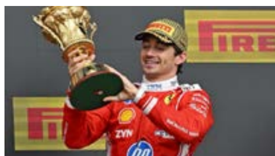
Antonelli salvó el liderazgo

El Gran Premio de Gran Bretaña ofreció un espectáculo cargado de incidentes, estrategias cambiantes y un final neutralizado por el ingreso del auto de seguridad. En ese escenario, Charles Leclerc se quedó con una valiosa victoria en el circuito de Silverstone, logrando así su primer triunfo del año y el noveno de su carrera en la Fórmula 1.