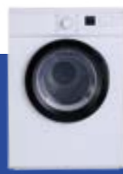
Lavasecarropas o secarropas