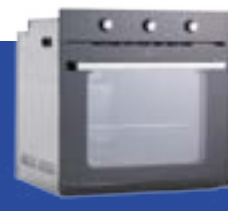
Hornos de empotrar cocinas totalmente eléctricas y anafes de inducción