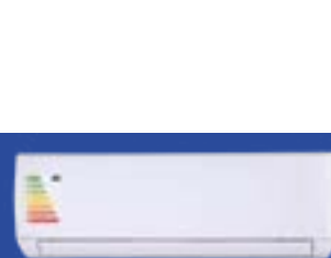
Aires acondicionados clase A