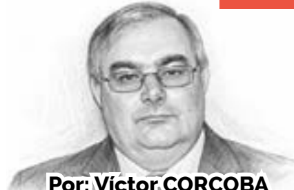
Por: Victor CORCOBA HERRERO