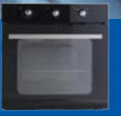
Hornos de empotrar