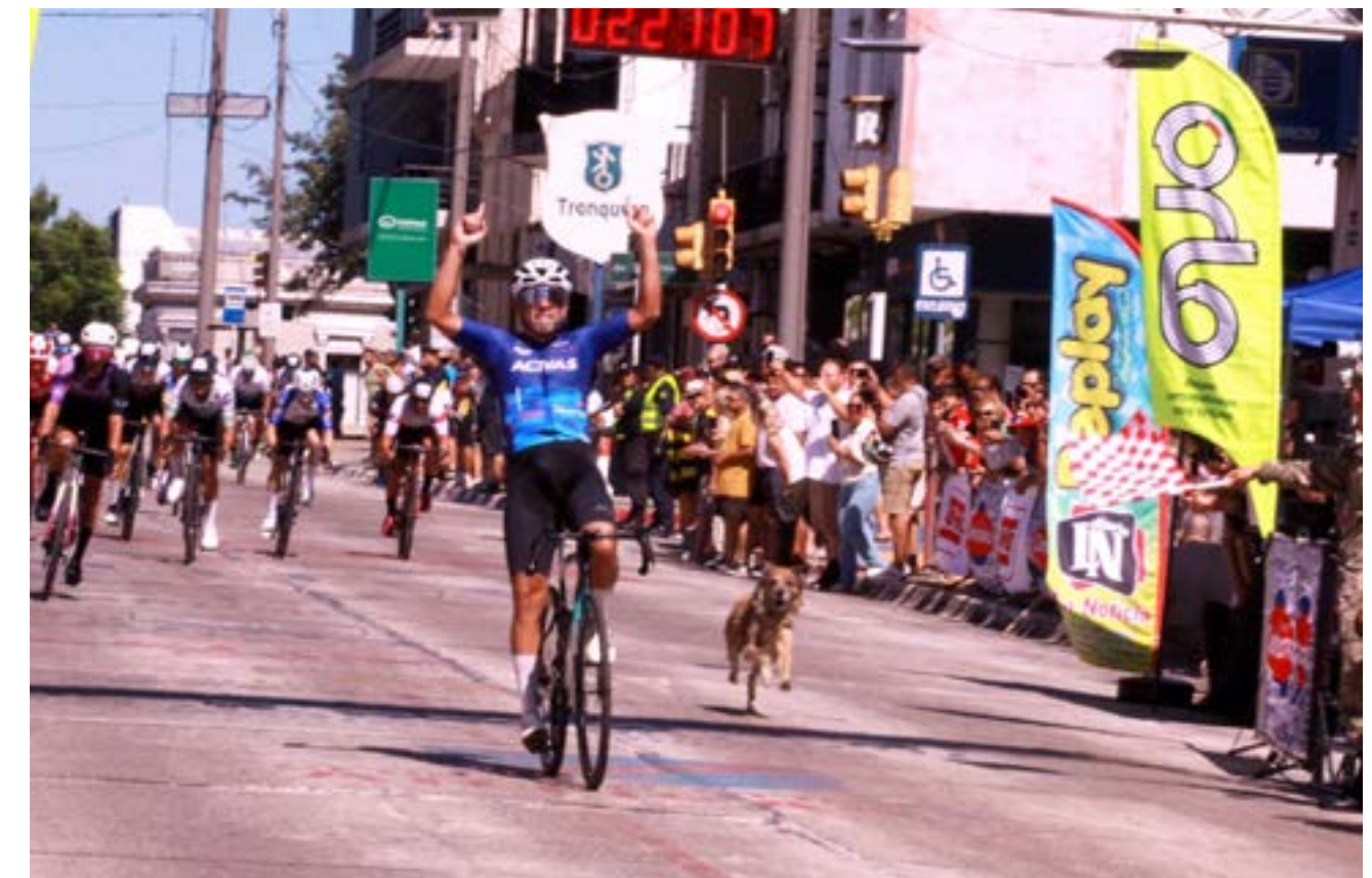
Foto de la primera llegada de las 500 Millas del Norte en la mirada mágica del fotógrafo Gustavo Carvalho.