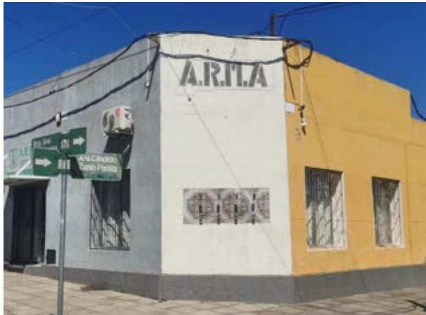
Redacción: Carla de Souza Nota: Rodrigo Nuñez

La institución comenzó con la elaboración de la memoria anual y el balance del ejercicio 2025, mientras mantiene en funcionamiento su espacio recreativo para socios, familiares y público en general.